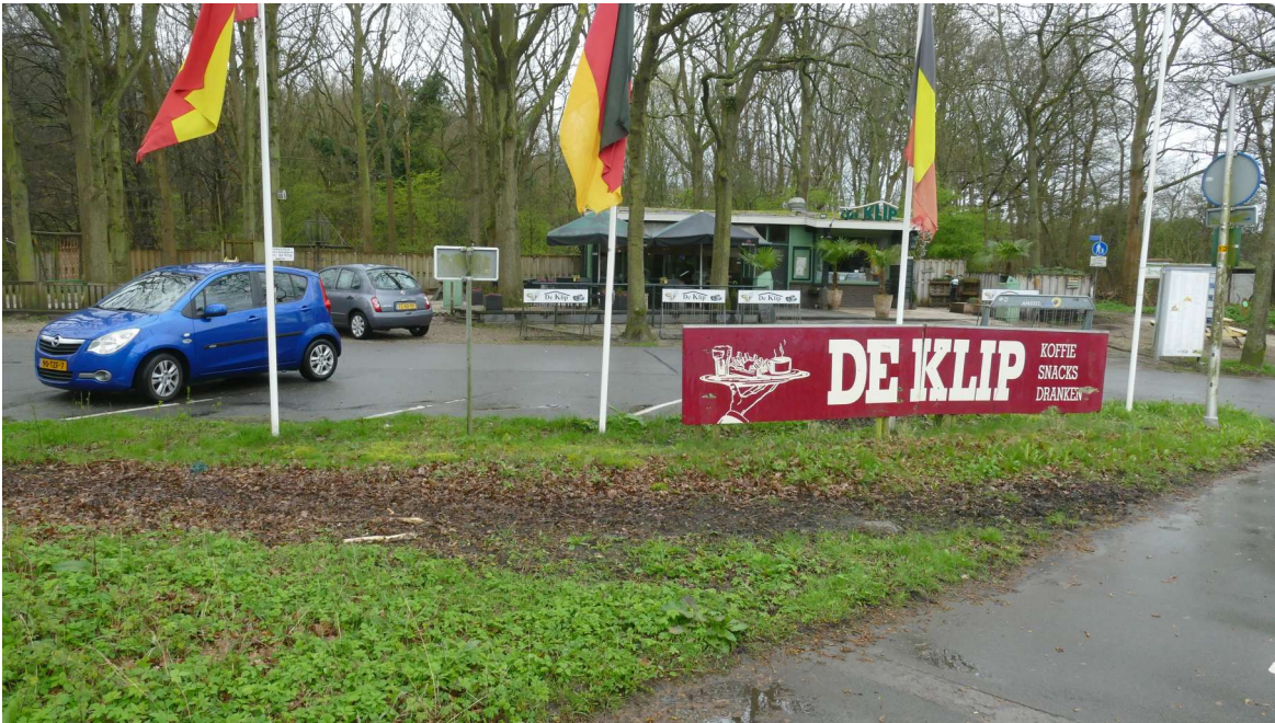
Voorbeeldlocatie De Klip met een koffietent, speeltuin, trimroute en zicht op de natuur.

Andere locaties waar deze mogelijkheden gerealiseerd zouden kunnen worden zijn: Berkheistraat en omgeving, Duindigt en omgeving, Else Mauhsaan, de Oude Waalsdorperweg en Pompstationsweg.