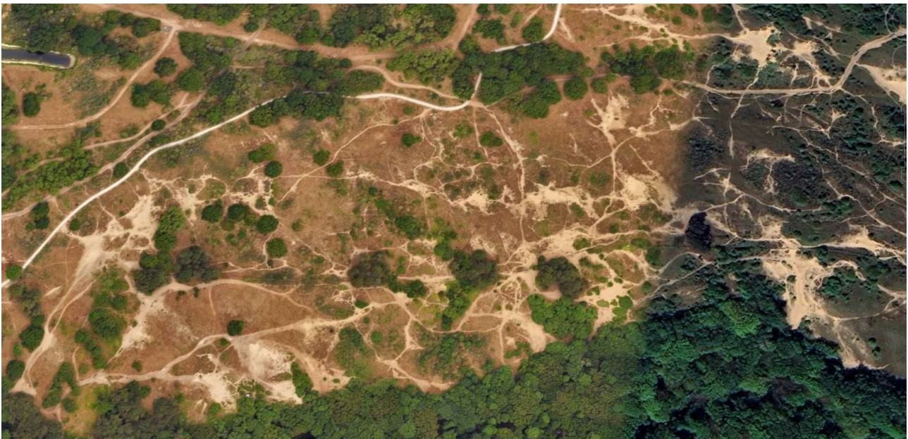
De wilde paden in het duingebied Waalsdorpervlakte/Oude Rijs.

Grote delen van dit duingebied zijn vertrapt als gevolg van het wandelen buiten de paden. Er is een netwerk ontstaan van wilde paden. De toegankelijkheid van dit gebied kan worden beperkt tot een aantal gemarkeerde wandelroutes. Dit vraagt zeker in het begin een strikte handhaving. Een markering van de wandelroutes kan worden aangebracht en sluippaadjes afgezet. Wellicht is het nodig om een lichte verharding aan te brengen d.m.v. schelpen voor de herkenbaarheid van het pad. Het hekwerk met Landgoed Voorlinden kan beter worden onderhouden (gaten dichten).