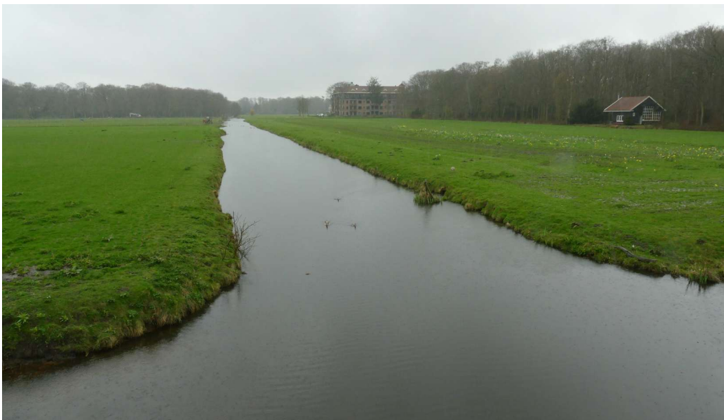
Langs wandel- en fietspaden kunnen rustpunten worden ingericht op locaties met een mooi uitzicht. Op deze locaties kan een bankje en informatiebord worden geplaatst met een verhaal over het landschap.

Een voorbeeld van een dergelijk rustpunt is de kruising van Rust en Vreugdlaan en Backershagenlaan. Hier heb je een mooi uitzicht over het weidelandschap, de bomenlaan en de watergangen. En met een picknickbankje en informatiepaneel kunnen bezoekers genieten van het landschap.