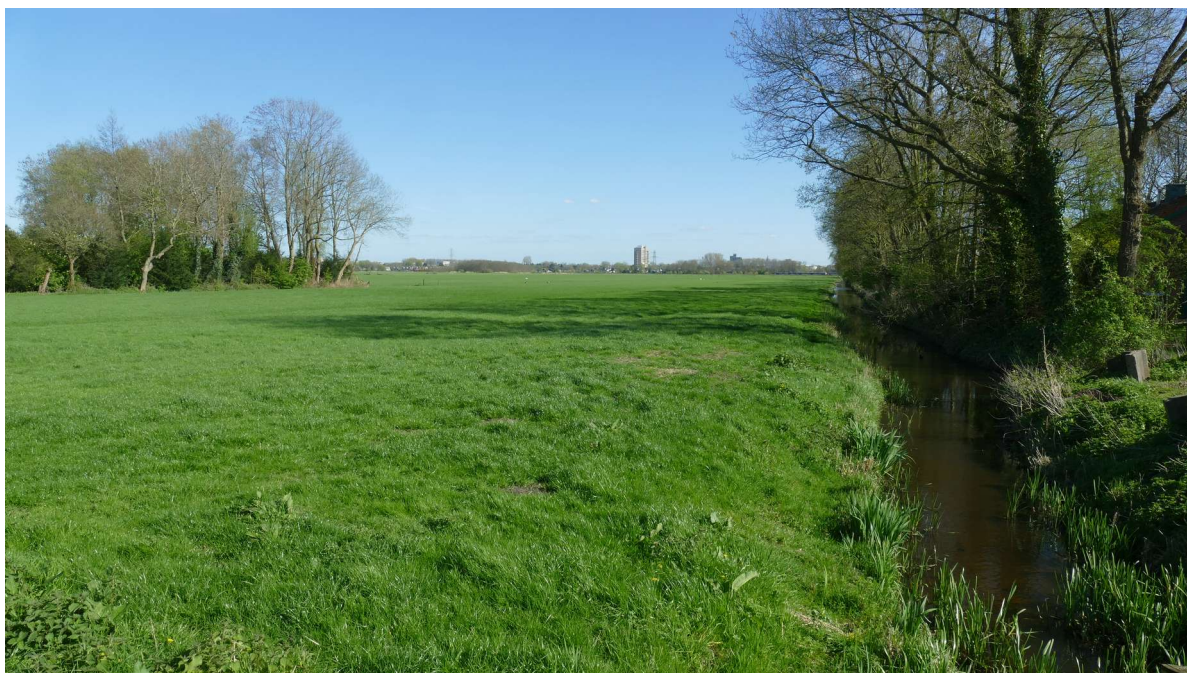
Zicht op de Duivenvoordse en Veenzijdse Polder vanuit De Landbouw.