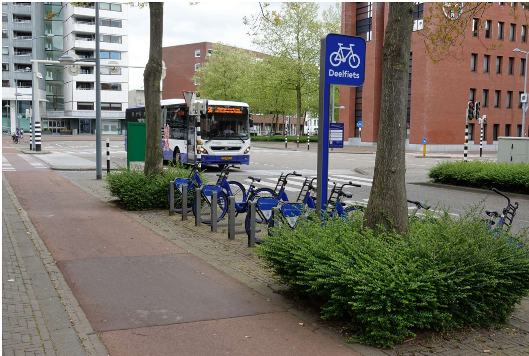
Fietsverhuur bij de bushalte.

Een aardig initiatief is ook de fietsverhuur bij bushaltes. Dit initiatief is o.a. in praktijk gebracht door busmaatschappij Arriva in Limburg. Bij diverse bushaltes kunnen deelfietsen worden gehuurd.