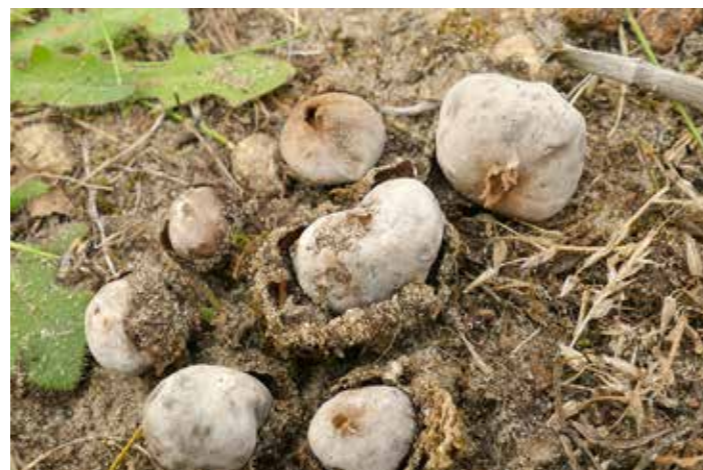
Kleine Kop-op-schotel in de Vrieze Wei, een van de twee groeiplaatsen in Nederland.

'Bijzonder Berkheide' is verkrijgbaar in boekhandels in de regio en via de webwinkel van Duinbehoud. Zie voor meer info de recensie elders in dit nummer.