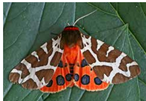
Grote beervlinder

Berkheide dankt zijn naam aan de valleien Groot en Klein Berkheide in het zuiden van Berkheide. Al sinds 1687 worden die op kaarten vermeld. De valleien hebben hun naam waarschijnlijk ontleend aan het dorpje Berckheij dat bestond van eind 14 de tot eind 16 de eeuw. Het dorpje Berckheij lag aan de kust, direct ten noorden van de Wassenaarse Slag. Een soort 'Wassenaar aan Zee' dus. Het was een vissersdorp, met als afzetgebied Wassenaar en Voorschoten. Er zijn nooit restanten van het dorpje gevonden, maar dat is niet zo verwonderlijk want het is waarschijnlijk door kustafslag in zee verdwenen.