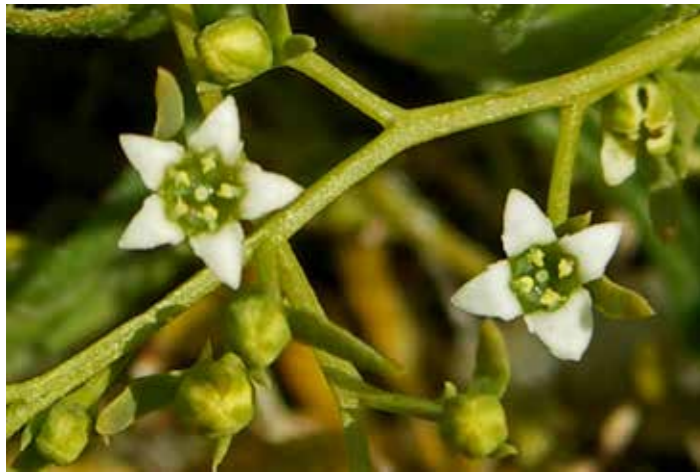
Liggend bergvlas.