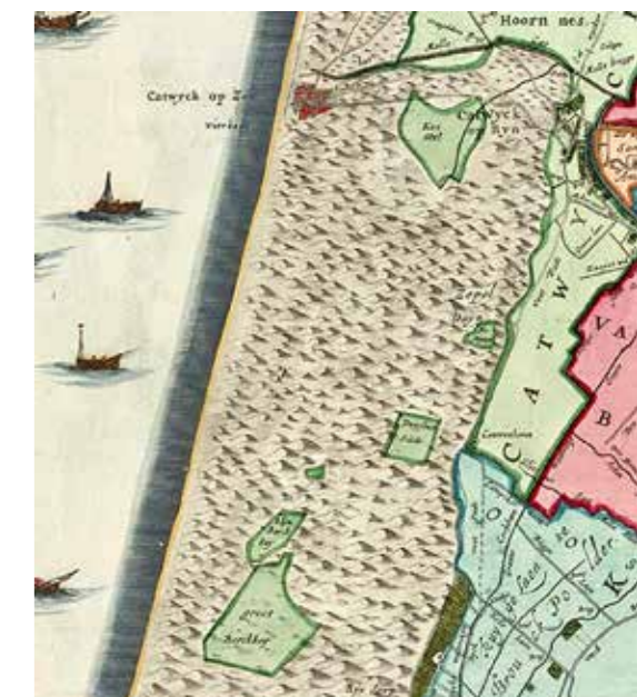
Kaart van "t 'Hoogheemraedschap van Rijnland" uit 1687, met de belangrijkste valleien in Berkheide.

vogeltrektelposten van Nederland. En dan vergeten we nog de vleermuisbunkers, de boommarter, de waterspitsmuis, de libellen en de dag- en nachtvlinders. Het is te veel om op te noemen en het past bij lange na niet in dit artikel. Gelukkig is er het boek. »