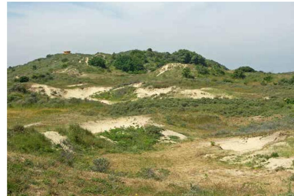
Het Vlaggeduin, met 37 meter het hoogste duin van Zuid-Holland.