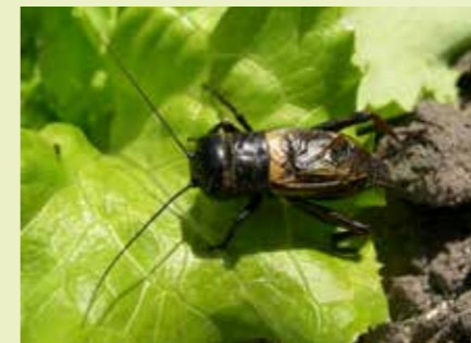
Veldkrekkel man