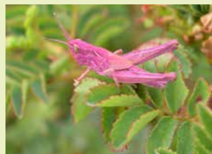
Roze nimf bruine sprinkhaan