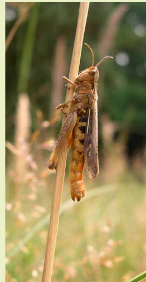
Bruine sprinkhaan

die niet kan vliegen. De snelle uitbreiding is tot stand gekomen doordat ze makkelijk meeliften op allerhande vervoersmiddelen. Tegenwoordig komt de zuidelijke boomsprinkhaan overal voor inclusief de Waddeneilanden Texel, Vlieland en Terschelling. In de duinen zijn de dieren vooral te vinden in eiken en essen in de omgeving van parkeerplaatsen. De duinsabelsprinkhaan is nog steeds de meest algemene soort in deze groep. Deze is in vrijwel alle duingraslanden van de Nederlandse kust gevonden.