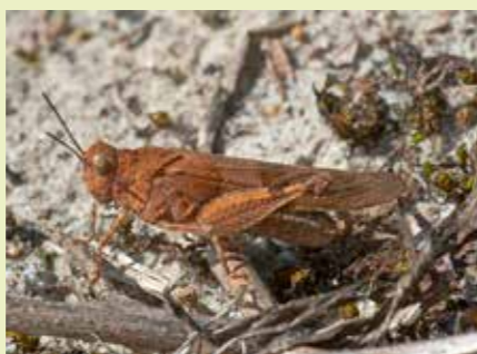
Blauwvleugelsprinkhaan vrouw