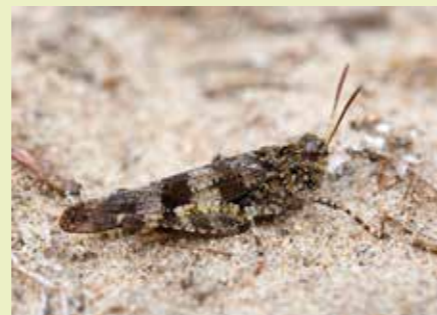
Blauwvleugelsprinkhaan man