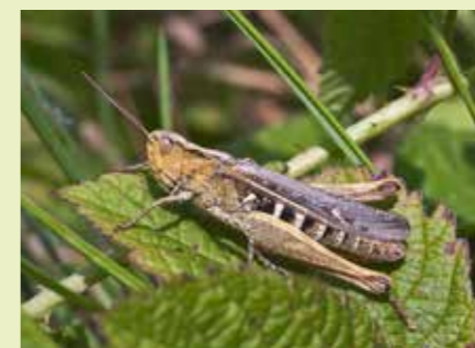
Bruine sprinkhaan