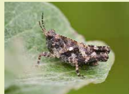
Nimf van waarschijnlijk een gewoon doorntje.