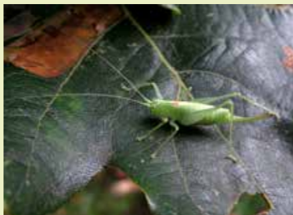
Zuidelijke boomsprinkhaan vrouw