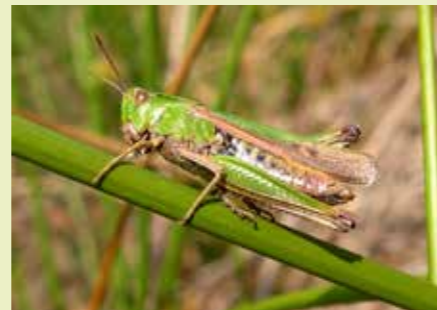
Wekkertje vrouw