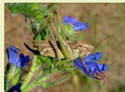
Duinsabelsprinkhaan vrouw