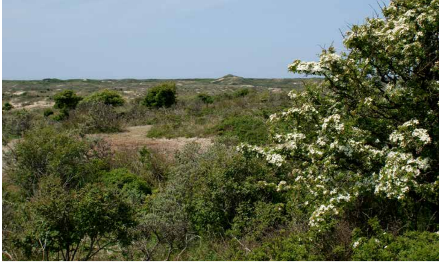
Duindoornstruweel is goed broedbiotoop voor nachtegalen.

genomen. Hier behoren nachtegale al jaren tot de meest algemene broed- vogels. In andere delen van Nederland is de nachtegaal tegenwoordig schaars en in de meeste streken bovendien fors afgenomen als gevolg van ver- droging en verdwijnen van vochtige loofbosjes en houtwallen. Vanwege de afname elders in het land is hij in 2004 op de Rode Lijst gezet. Van alle Nederlandse nachtegale - ongeveer 7.000 paar - broedt nu meer dan twee- derde in de duinen. Het is dus een