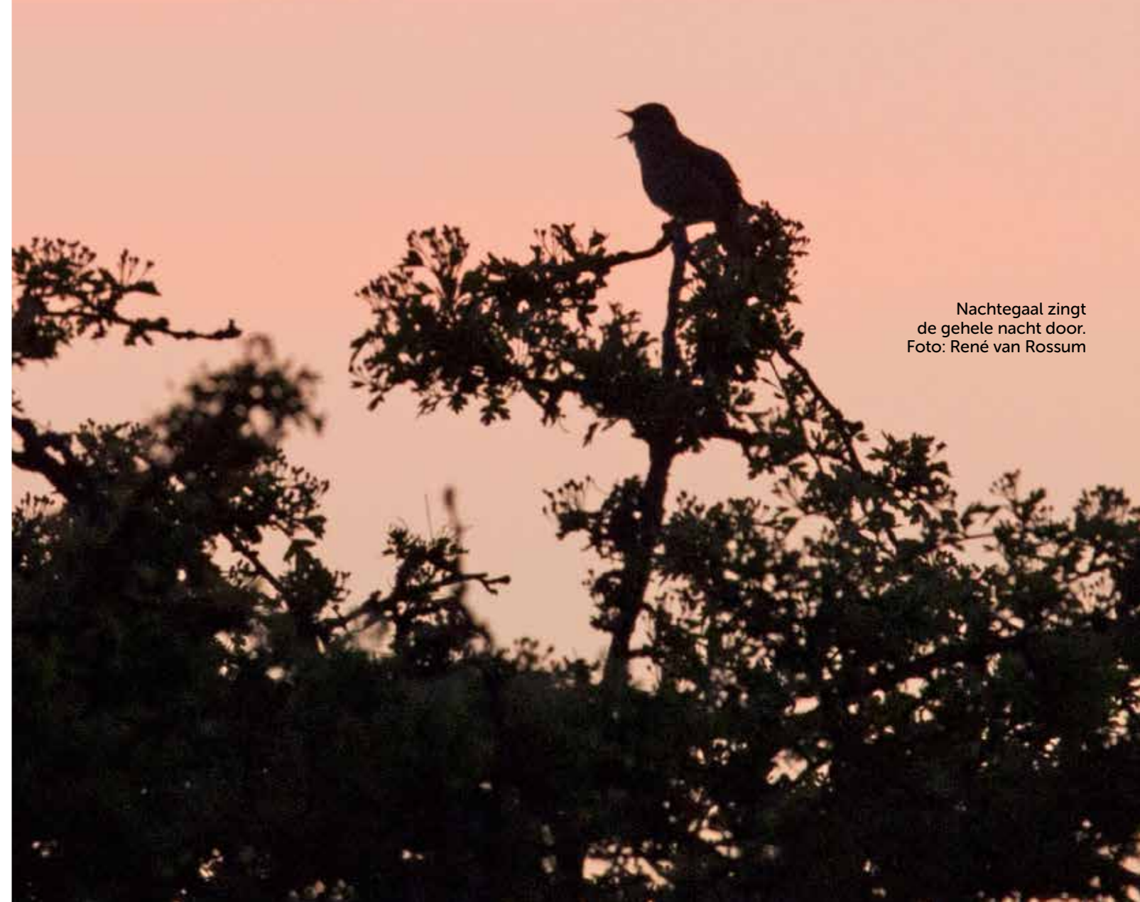
Nachttegaal zingt de gehele nacht door.

In mei en juni worden tijdens zwoele zomernachten excursies georganiseerd om de rijk geschakeerde zang van de nachtegaal te beluisteren. Dat heeft iets romantisch. Maar vogelaars die broedvogels inventariseren door 's ochtends vroeg zangplekken te noteren snappen dat niet helemaal. De nachtegaal zingt dan ook prima, beter dan 's nachts. Toch is er een groot verschil tussen ochtend en nacht. Nachtegaalvrouwtjes werden door onderzoekers uitgerust met zendertjes. Daaruit bleek dat zij alleen 's nachts belangstelling hadden voor mannen die dan hun serenades brachten. Dan zingen ongepaarde mannetjes die over een mooi en aantrekkelijk territorium beschikken. Mannen die al onder de pannen doen er dan het zwijgen toe. De ochtend is voor de jongens onder elkaar. Alle nachtegaalmannetjes, met of zonder vrouwtje, zingen dan om de concurrentie duidelijk te maken waar de grenzen van hun territorium zijn. De vrouwtjes bemoeien zich daar niet mee.