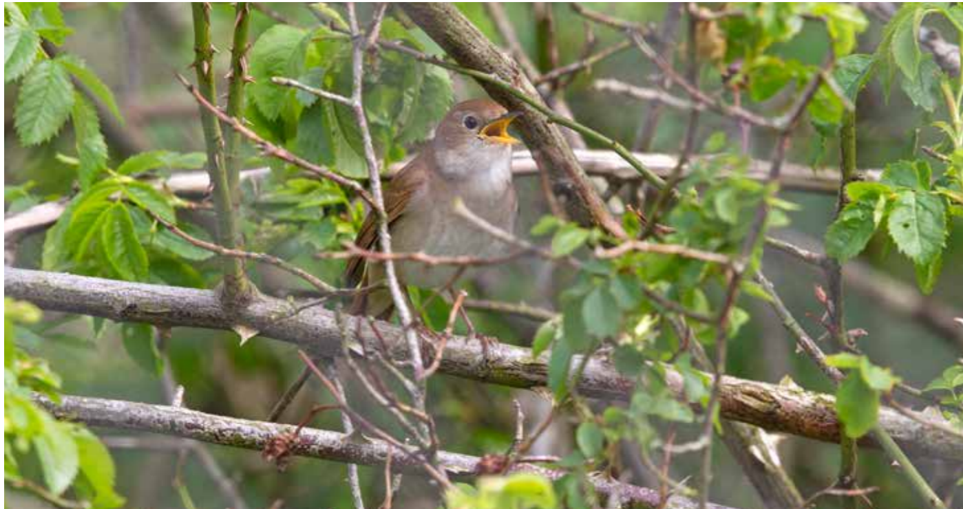
Verscholen in dichte struiken en ondergroei, liefst van brandnetels, voelt de nachtegaal zich prima op zijn gemak.